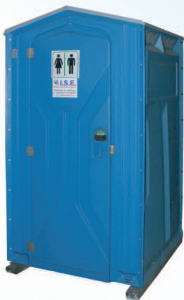
mod. ISE elegance