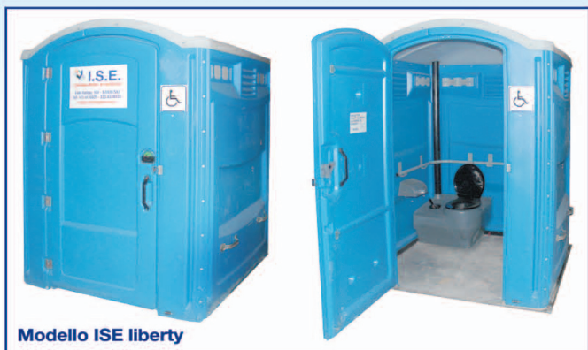
Modello ISE liberty

Il modello I.S.E. liberty è un bagno portatile per i diversamente abili , costruito in polietilene ad alta densità, privo di parti metalliche. L'illuminazione interna della toilette è ottenuta tramite tetto traslucido. Le superfici interne ed esterne di questo modello di wc permettono una veloce e pratica pulizia. Ogni bagno è dotato di wc coperto posizionato su serbatoio di raccolta liquami che, data la sua profondità, garantisce un'efficace ventilazione.