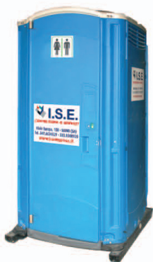
mod. ISE vip

CONCERTI - SAGRE - FIERE MEETING - MERCATI - LITORALI - CAMPEGGI etc.